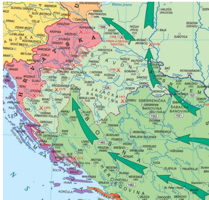
(Karta Razvoj Osmanskog carstva- GD Dizajn)